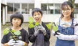
県の脱炭素啓発事業「緑の陣」でグリーンカーテンを育成中