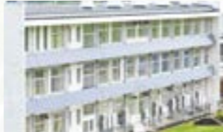
太陽光発電設備が設置されている豊原小学校