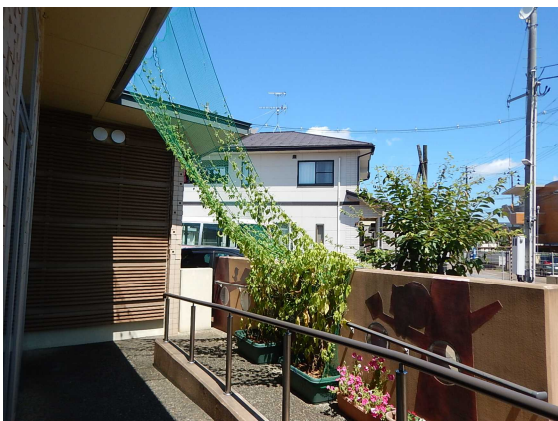
あそびの森すみよし保育園③