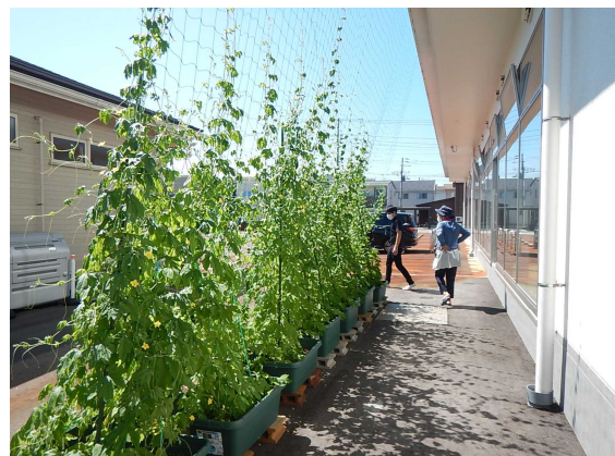
エンジェルkids 陽だまり園 (裏)