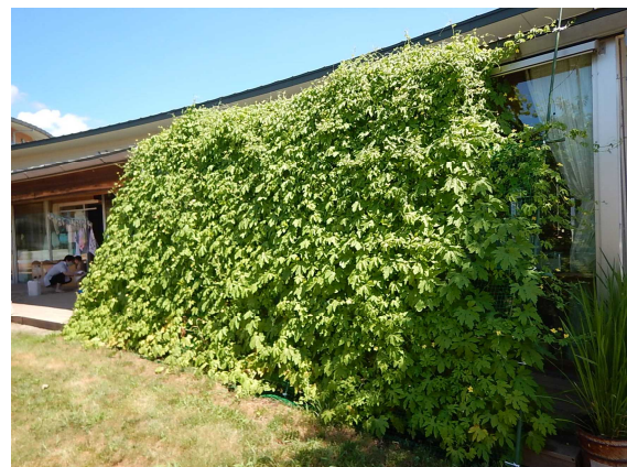
あそびの森すみよし保育園②