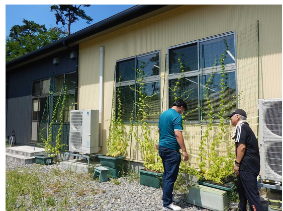
ふれあいしうんじ