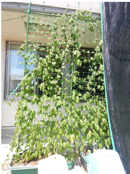
新発田聖母こども園