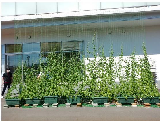
エンジェルkids 陽だまり園 (表)