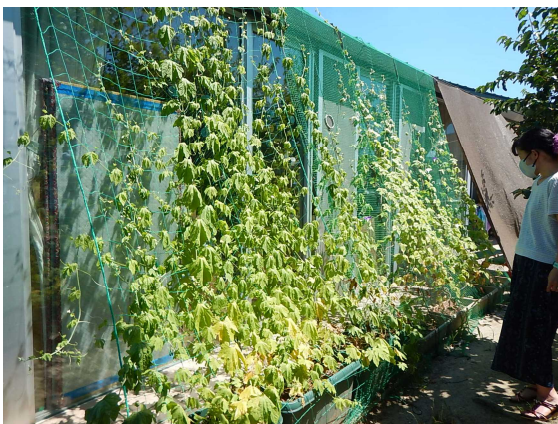
あそびの森すみよし保育園①